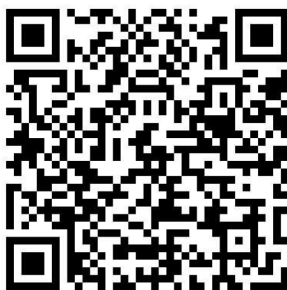
图 1 领卡二维码

1、使用 手机微信 扫描下方图 1 所示领卡二维码（或点击下方领卡网址）即可进入领卡界面。